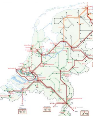
Het Nederlandse hoogspanningsnetwerk in januari 2005. Netten in pixels zijn in aanleg