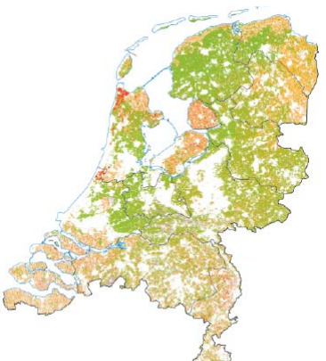
Gewaspercelen in juli 2005. Groene graslanden, roze mais en voedergewassen, rode tuinbouw