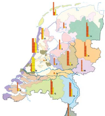
Aantal overnachtingen (x mln) van Nederlandse (rood) en buitenlandse (geel) toeristen in 2005