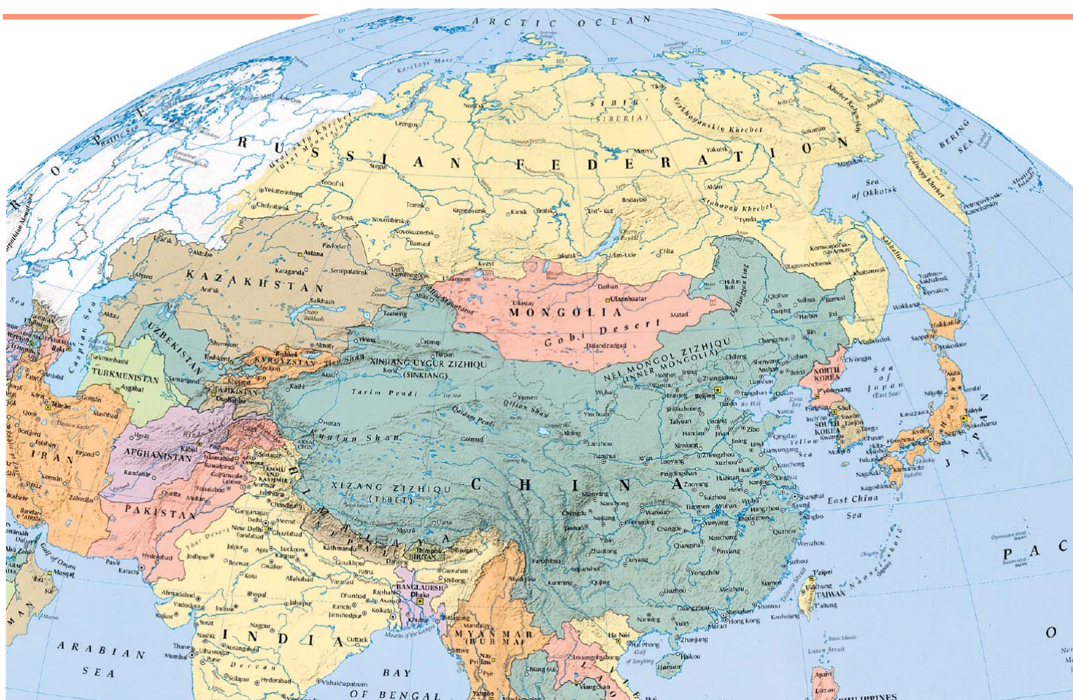
Azië. Kaart 13 uit de Times Comprehensive Atlas of the World

En toch wringt er iets. Voor zo'n gewichtig naslagwerk ogen de thematische keuzes vaak arbitrair. In de provincie Groningen zien we de meeste boekhandels per hoofd van de bevolking. Waarom wordt niet duidelijk, noch het belang van deze wetenschap. Kun je via dergelijk meten wel bij begrip komen, of is er sprake van die opperste leugen: statistiek? Zoals Daniel Kehlmanns roman Het meten van de