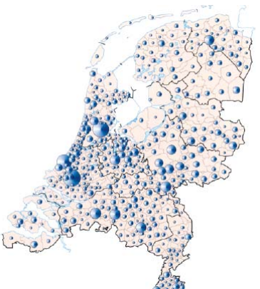
Het aantal verzorgingstehuizen per gemeente in 2005